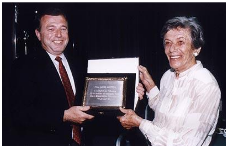
דויטש מקבלת אות הוקרה על הישגיה

הספר לבישול. מנימת קולה אפשר להתבלבל כאילו אין כאן משהו עקרוני, אלא סתם הנטייה הייקית למלא את ההוראות. "פשוט שם, בגרמניה", סיפרה בציניות יבשה, "בכל בריכות השחייה כתוב שהכניסה לכלבים ויהודים היא אסורה".