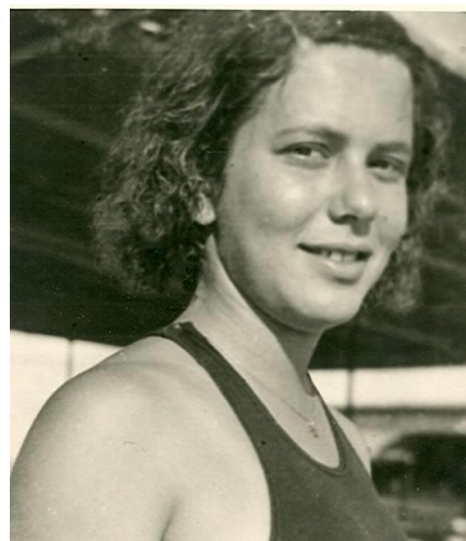
דויטש בצעירותה כשחיינית